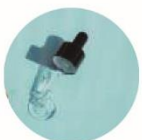
ナイアシンアミド