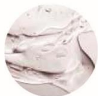
テトラヘキシルデカン酸 アスコルビル（保湿成分）