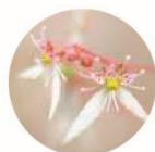
ユキノシタエキス