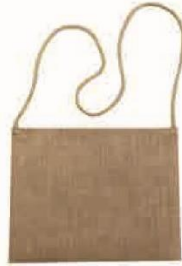
ジュートバッグ サコッシュ (M) サイズ：W320×H250mm 材質：ジュート・PE（本体） ジュート（ショルダー）