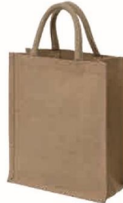
ジュートバッグ (A4) サイズ：W270×H320×D120mm 材質：ジュート・PE (本体) コットン (ハンドル)