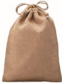
ジュートポーチ サイズ：W270×H370mm 材質：ジュート・PE (本体)