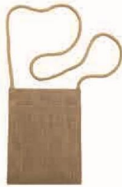
ジュートバッグ サコッシュ (S) サイズ：W170×H225mm 材質：ジュート・PE（本体） ジュート（ショルダー）