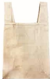
コットン (4.5oz) マイレジ袋 (L) サイズ：W350×H610×D110mm 材質：コットン（本体）