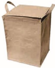
ジュート収納ボックス① サイズ：W300×H400×D280mm 材質：ジュート・PE（本体） ジュート（ハンドル）