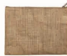
ジュートポーチ サイズ：W270×H200mm 材質：ジュート（本体）