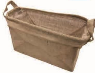
ジュート収納ボックス④ サイズ：W250×H190×D150mm 材質：ジュート・PE（本体） ジュート（ハンドル）