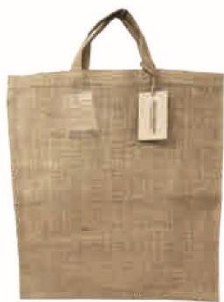
ジュートショッピングバッグ ラミ無し (UL) サイズ：W380×H420mm 材質：ジュート (本体) ジュート (ハンドル)