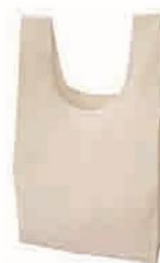
コットン (5oz) マルシェバッグ (M) サイズ：W300×H530×D100mm 材質：コットン（本体）