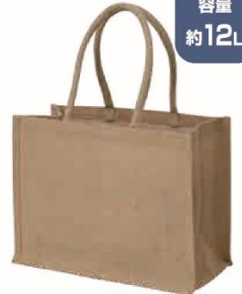
ジュートバッグ (M) サイズ：W400×H300×D195mm 材質：ジュート・PE (本体) コットン (ハンドル)