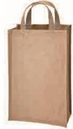
ジュートワインバッグ 2本用 サイズ：W200×H350×D100mm 材質：ジュート・PE（本体） ジュート（ハンドル）