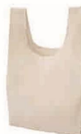
コットン (5oz) マルシェバッグ (L) サイズ：W400×H700×D150mm 材質：コットン（本体）