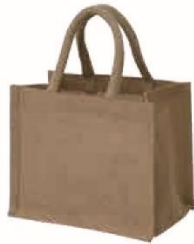
ジュートバッグ (S) サイズ：W240×H200×D150mm 材質：ジュート・PE (本体) コットン (ハンドル)