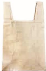
コットン (4.5oz) マイレジ袋 (M) サイズ：W290×H550×D120mm 材質：コットン（本体）